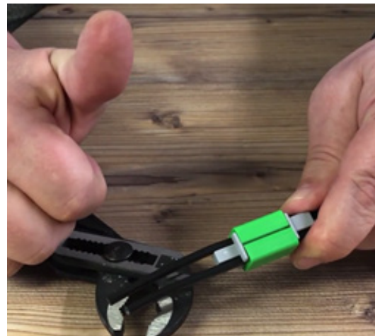
Seite 2 ist OK

Schritt 6: Montage von 2 Stk. Kabelbänder links und rechts – gegen unbeabsichtigtes ▷ Auseinanderziehen der Kabel = Sicherheitsmaßnahme.