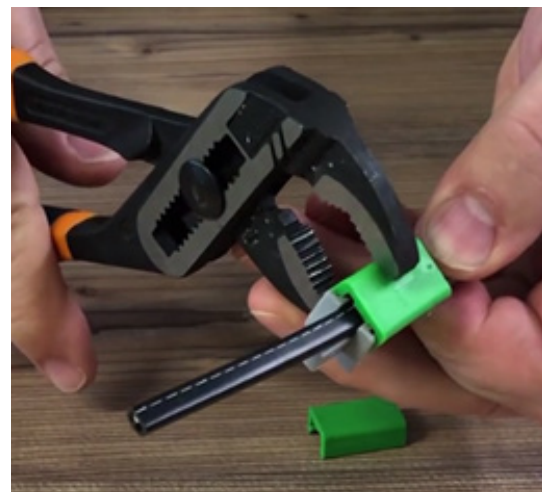
Seite 2 pressen bis „Klick“