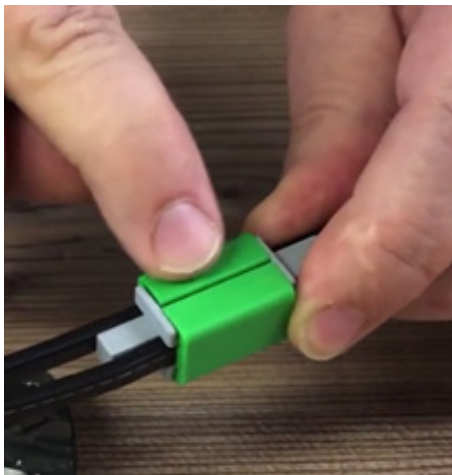
Seite 1 ist OK

Schritt 5: Kontrolliere ob beide Seiten der Kappen schon eingerastet haben